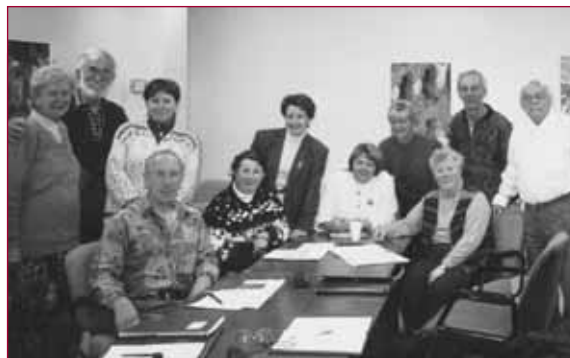
Cours Comment garder la mémoire active à la retraite

Buffet Antique, rue Sherbrooke Est. Plus de 275 personnes s'y amusent ferme.