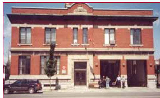
791, rue Jarry Est 2000 -