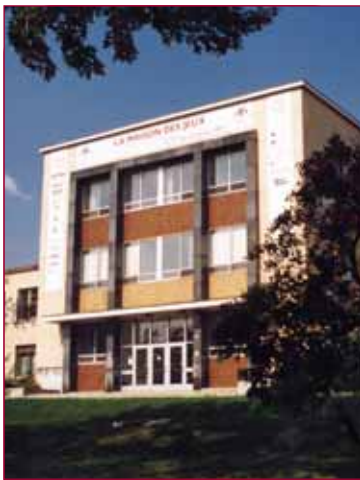
1301, rue Sherbrooke Est, bureau 1110 1995 - 1998

Durant ses 40 ans au service des employés retraités, c'est dans ces différents édifices que les membres du comité exécutif, du conseil d'administration, avec l'aide des bénévoles, ont tenu leurs nombreuses réunions pour régler des dossiers ou tout simplement organiser les multiples activités sportives ou culturelles auxquelles ont participé en très grand nombre les membres de l'AER.