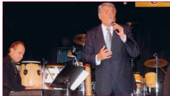
Gala 40e Le chanteur Michel Louvain

Vers la fin de l'année, on apprend avec plaisir que le dossier des retraités et conjointes survivantes non-indexés d'avant 1983 chez les professionnels est en bonne voie de règlement et devrait se conclure au début de l'année 2009. ■