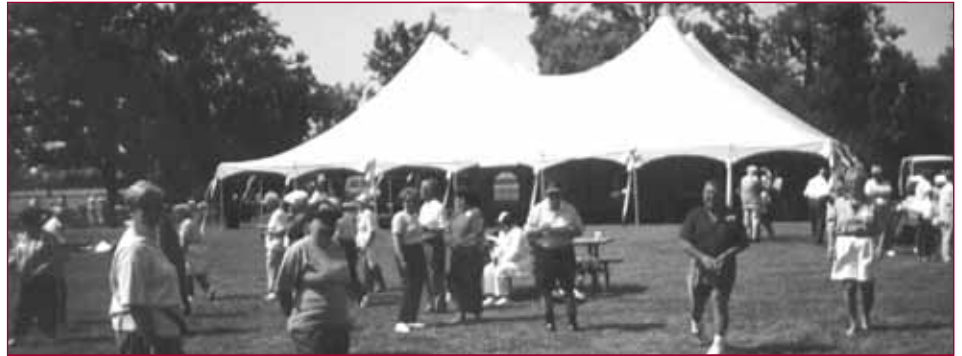
Gala 30e AER 1ère fête plein air à l'Île Sainte-Hélène

Le souper gala des 30 ans de l'AER se tient le 25 septembre, au