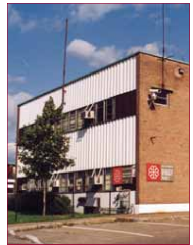
1400, rue Des Carrières 1998 - 1999