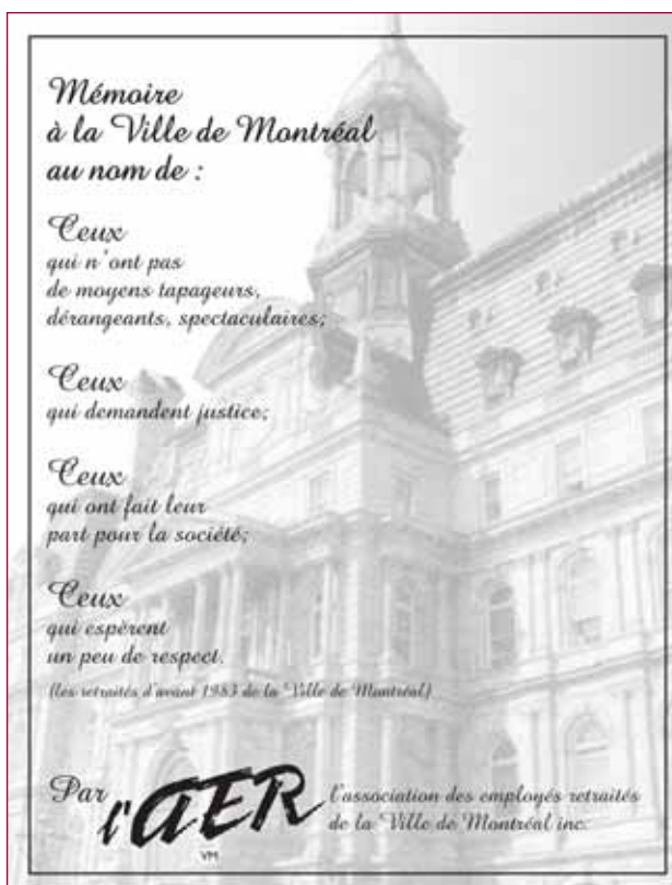
Présentation du mémoire à l'hôtel de ville

Le 23 octobre, à la suite d'une initiative du président Jean Des Trois Maisons, une quarantaine de membres de l'AER se dirigent vers Québec à l'invitation du président de l'Assemblée nationale, M. Michel Bissonnet. Les membres seront reçus à l'Assemblée nationale, auront droit à un cocktail de bienvenue et à un repas au restaurant Le Parlementaire.