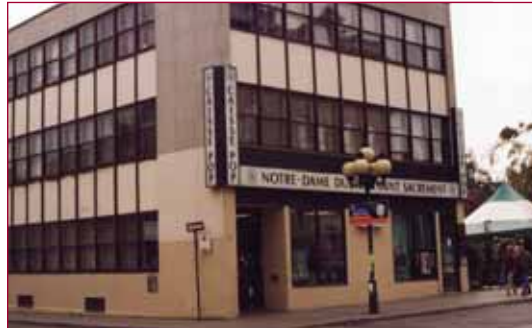
480, rue Mont-Royal Est 1982 - 1989