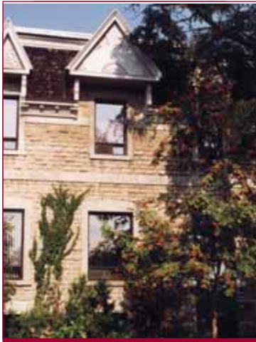
429, rue de La Gauchetière Est 1968 - 1982