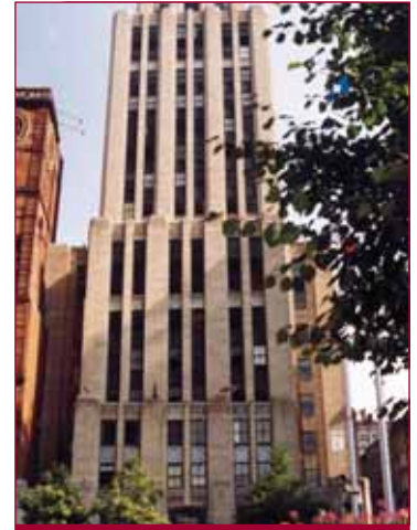
507, Place d'Armes, bureau 1010 1989 - 1995