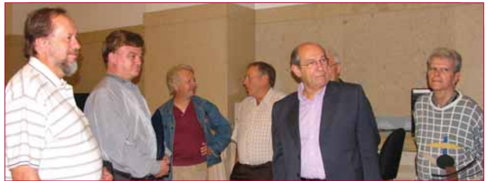
À l'hôtel de ville, 28 août 2006